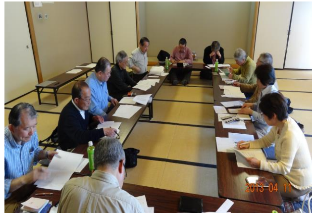
俳句同好会にお邪魔してみました