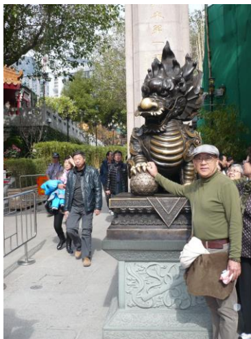
最近、何度か訪れている香港の寺にて

原発の20キロ圏内に位置するため、かつてのように開催できないのが現状です。 一日も早く元の場所に戻る日を願って止みません。