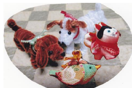
上澤さんが制作された作品