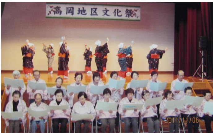
花見小唄公演の様

また、ガリ版刷りの旋律譜だけが残っていた宮崎市高岡町の「花見小唄」を編曲し、シンセサイザーの演奏でCDを制作。それによって50年振りに町に踊りが復活し、ことあるごとに歌と踊りで町が盛り上がっているそうです。合唱指導にCD制作。音楽家らしい地域貢献に「いつまでも拍手」です。（石原勝年記）