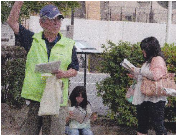
ただいま観光ガイド中

愛知県・長久手市に居住して約 1/4 世紀、今迄で一番長く過ごした地になり第二の故郷になっていますが、現役時代には自宅と会社の往復で、殆ど地元長久手とは没交渉でした。6年前に長久手町主催の歴史講座を受講していた時、30年の歴史のある「長久手市郷土史研究会」があることを知って入会し、色々勉強しております。現在は60数名の会員で、地元の方も含め大半の方が小生同様、退職した歴史好きの方々です。私はガイド委員会に所属し、月1度の勉強会と、史跡巡りのガイドを行っております。天正10年に京都の本能寺で織田信長が明智光秀に討たれ、信長の後継者をめぐって羽柴秀吉と織田信雄・徳川家康連合軍が対決したのが「小牧・長久手の戦い」ですが、その主戦場跡地のある地が、いま私の住んでいる長久手市です。