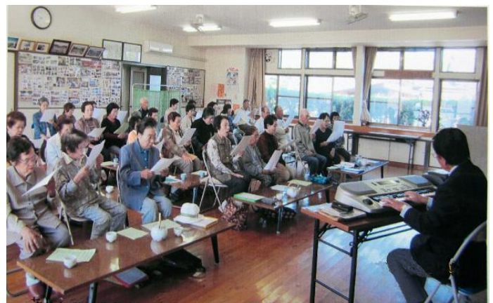
生涯学習講座の風景